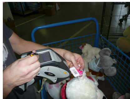
Lectors utilitzats, connectats "on-line" amb sistema ERP G2-Gest via "wi-fi"...

G2-TIRIS Solució per a la gestió i planificació de recursos empresarials (ERP)