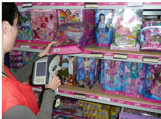
...inventariant articles al magatzem...