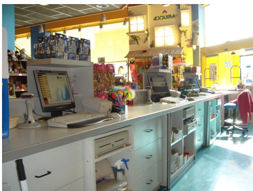
...venda al detall...