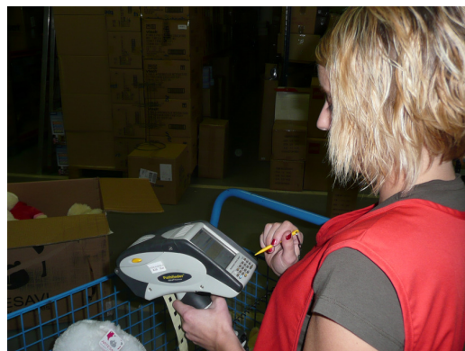
...etiquetant articles al magatzem...